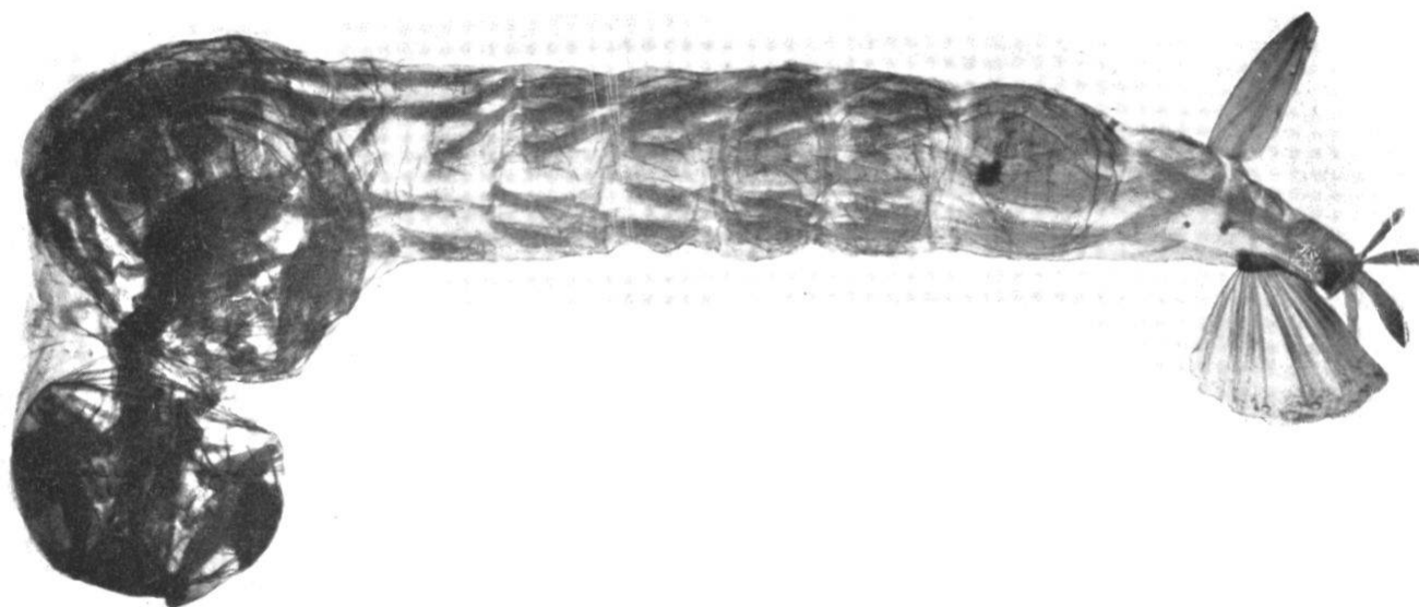
FIG. 1. — Larve de Mochlonyx Velutinus.