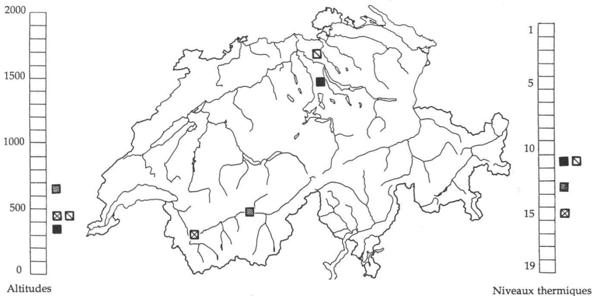
Figure 1.- Hemianax ephippiger en Suisse.

Les trois sites sont situés en plaine, 390-620 m. Le climat y est relativement tempéré. Les niveaux thermiques (SCHREIBER 1977) respectifs, 13-15-11 (numérotation: 1=le plus froid, 19=le plus torride), nous indiquent des températures moyennes estivales (avril-octobre) allant de 13°C à 15.5°C.