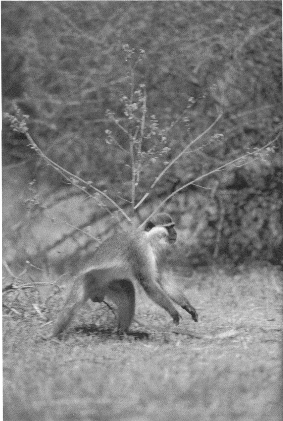
Figure 1.—Un cercopithèque aethiops