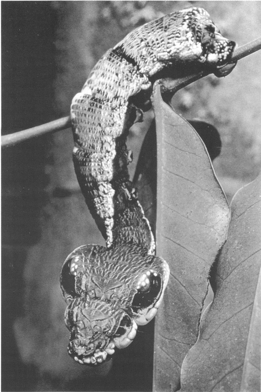
Figure 2.—Certaines chenilles de grande taille, comme Leucorampha ornatus (Sphingidae), quand elles sont approchées par un oiseau, tournent leur thorax gonflé vers lui et font apparaître deux cercles noirs. Doucement elles balancent cette «tête de vipère» comme un vrai serpent (CURIO 1964).