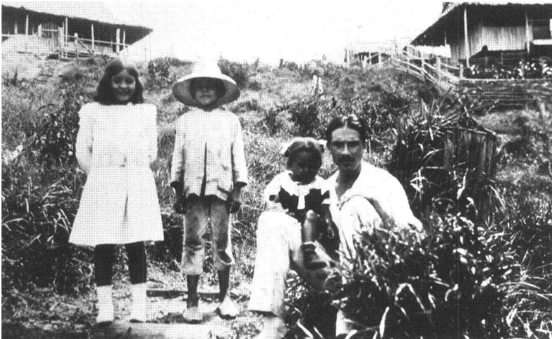
Figure 4.–François de Loys posant avec des enfants de la région du Río Tarra, au Venezuela. Cette photo paraît correspondre au campement de El Cubo, aux environs de 1920. (Archives de la Ville de Lausanne, P 282 famille de Loys).