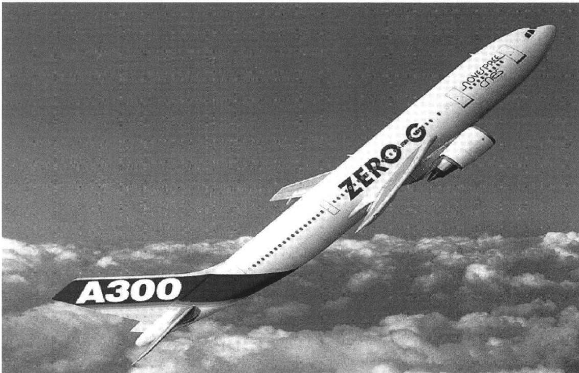
Figure 1.—Airbus A-300 ZERO-G avec une inclinaison de 47^\circ juste avant la période de microgravité. Cette photo a été prise dans un espace de vol réservé à l'Airbus A-300 ZERO-G au dessus de l'océan Atlantique.

riel est soumis à un contrôle et à des tests très stricts effectués par le Centre d'Essai en Vol (CEV). Vu les conditions spéciales rencontrées dans ce type de vol, les expérimentateurs doivent également passer les tests d'aptitude Jar-Fcl classe 2 et en caisson hypobar. Au cours d'un vol de 3 heures, 31 paraboles sont exécutées, donnant ainsi la possibilité de réaliser un nombre appréciable d'expériences.