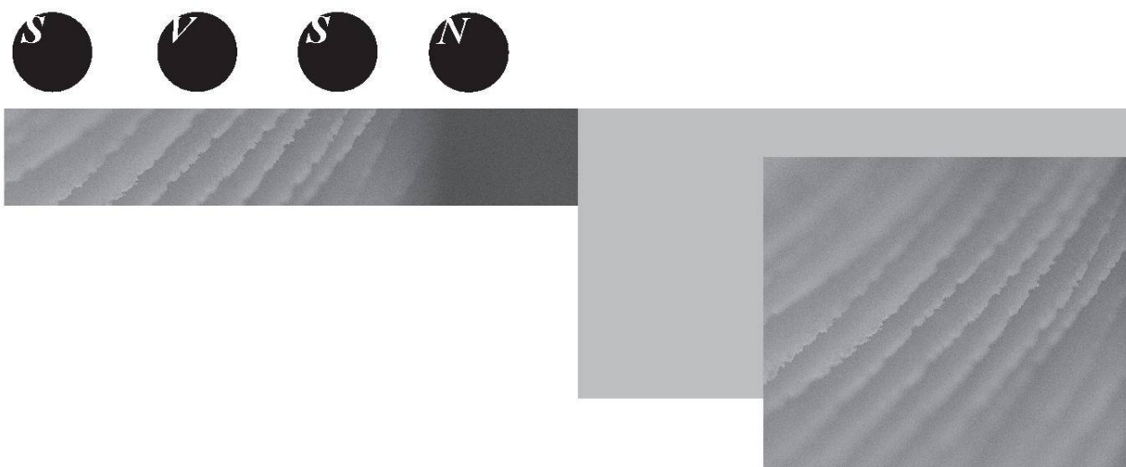
Photo de la couverture (E. Pouivé & G. Yannic) Détail des lames d'un chapeau de lépiote ( Macrolepiota procera )

Les archives des bulletins et des mémoires de la SVSN sont maintenant disponibles en ligne à l'adresse suivante: http://retro.seals.ch Il s'agit de la plateforme du consortium des bibliothèques universitaires suisses.