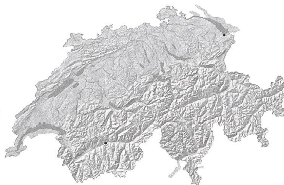
E. Ranunculus rionii Lager. Dernières observations en Suisse en 1994 (Thurgovie) et 1997 (Valais).