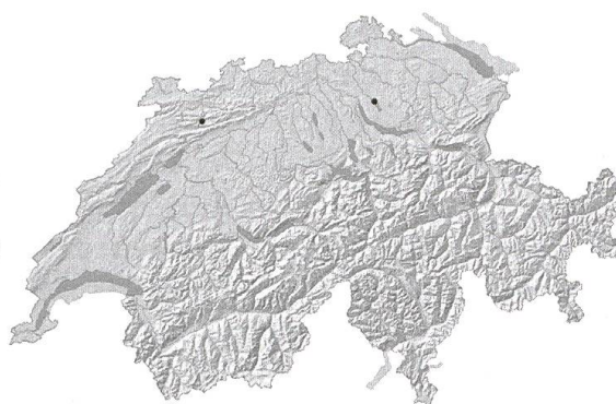
C. Ranunculus penicillatus (Dumort.) Bab. Dernières observations en Suisse à Moutier (1959) et au Greifensee (1990).