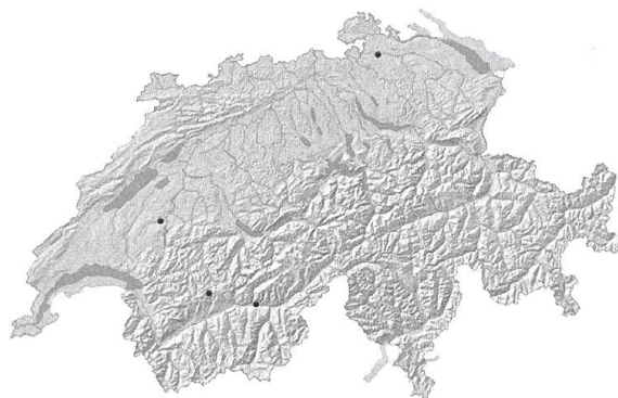
A. Ranunculus aquatilis L. Distribution actuelle en Suisse.