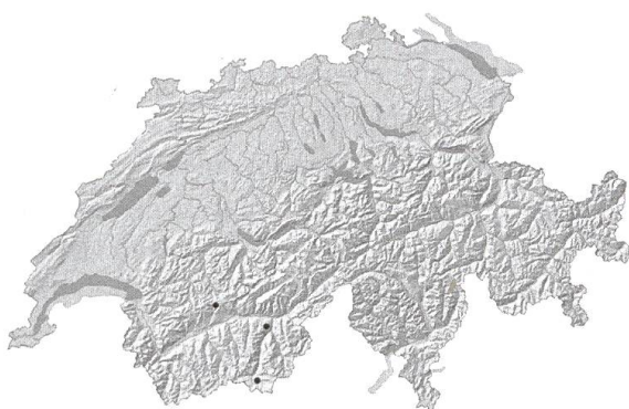
B. Ranunculus peltatus Schrank. Distribution actuelle en Suisse.