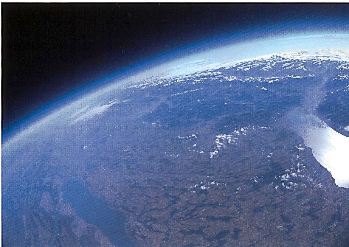
Le canton de Vaud vu du ciel, avec le lac de Neuchâtel à gauche, le lac Léman à droite et les Alpes en arrière-plan.

La préparation a été la phase la plus importante. Mon ballon va devoir monter en deux heures jusqu'à plus de 31'000 mètres, éclater après s'être dilaté pour compenser la diminution de pression externe, descendre en chute libre sur près de 10'000 mètres puis être freiné par le