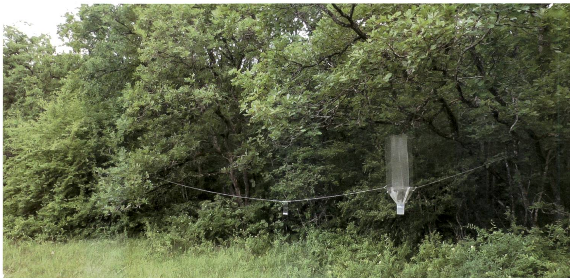
Figure 2. Piège d'interception utilisé (illustration du piège 1c - Bois de Chênes-Echilly).