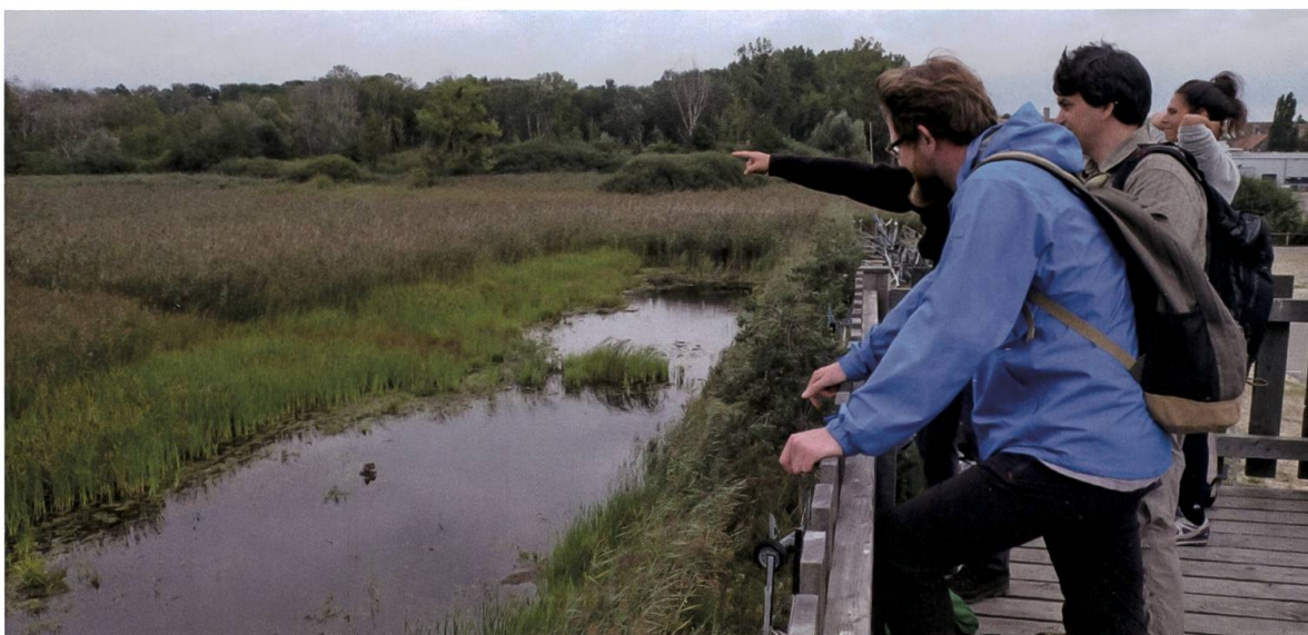
Regards sur la Grande Cariçaie lors de l'excursion de l'UVSS.

Les connaissances acquises en écologie et en biologie nous permettent de mieux comprendre comment et pourquoi certaines espèces végétales et animales sont aujourd'hui menacées. Dans des zones spécifiquement dédiées à la préservation et à la promotion du patrimoine naturel comme la Grande Cariçaie, certains travaux d'aménagement et d'entretien se justifient pleinement : ils sont en effet destinés à obtenir une meilleure qualité de milieux naturels présents ou à faire réapparaître les biotopes disparus. Par l'entretien approprié de surfaces de compensations écologiques ou par la mise en place de réseaux agro-environnementaux, l'agriculture peut aussi apporter de précieuses contributions afin de stopper l'érosion inquiétante de la biodiversité en Suisse. Cette excursion a permis d'illustrer sur le terrain ces problématiques et d'apprécier les résultats de certains travaux entrepris.