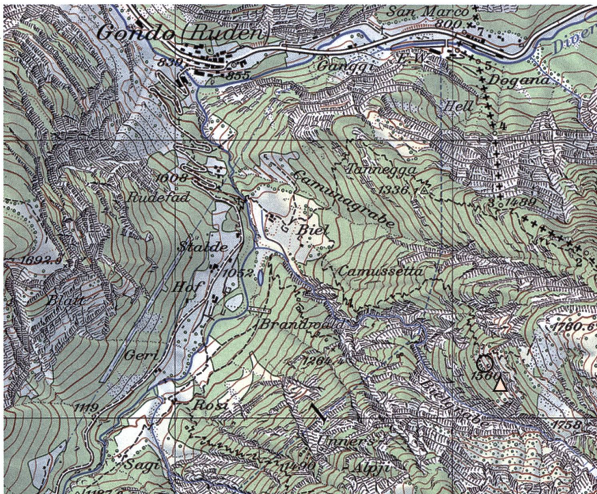
Figure 1. Carte de Gondo de 1980, présentant les anciens chemins d'accès aux mines. Le triangle représente Die Camoscellahöle ou Grotte de marbre, le cercle montre l'emplacement du campement du 21.08.2021 sur les anciens baraquements des mines, tandis que le petit lac en bas de la vallée était le lieu de capture 2020, où nous avons inventorié de nombreuses espèces.