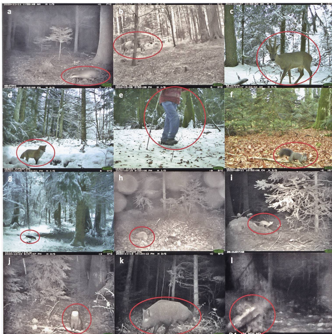
Figure 2. Espèces capturées sur le réseau de pièges photographiques. a) blaireau d'Europe, b) cheval, c) chevreuil européen, d) renard roux, e) humain, f) écureuil roux, g) chien domestique, h) hérisson d'Europe, i) Martes sp. (martre des pins et fouine), j) putois, k) sanglier, l) chouette hulotte.

jours ont été divisés en 5 périodes de 4 semaines environ. Les résultats hebdomadaires par site et par espèce sont présentés sous forme de tableau dans l'annexe II. La présence de chiens a été relevée sur 11 des 20 sites positionnés dans la zone centrale et celle des humains sur 18 (annexe II).