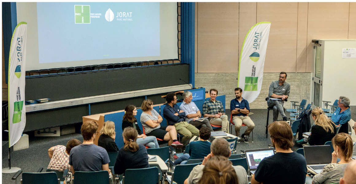
Figure 2. Table ronde « Articulations et échanges autour des monitorings de la biodiversité, de l'échelle locale à nationale ».

à l'augmentation du niveau de connaissances et de compréhension de la population. Un autre point soulevé relève de l'importance des indicateurs choisis. Les différents monitorings menés à l'échelle nationale (Monitoring de la Biodiversité, WaMos, etc...) sont à un maillage large afin de pouvoir attester de l'efficacité des politiques publiques mises en œuvre. Pour un périmètre plus restreint, tel qu'une aire protégée, il est important de réfléchir plus précisément à la méthodologie (réseau de placettes d'échantillonnage par ex.) ainsi qu'aux indicateurs qui seront renseignés pour répondre aux questions que les gestionnaires et politiques se posent. Ces derniers doivent être scientifiquement utiles mais aussi vulgarisés et facilement communicables. De plus, les méthodologies pourraient bénéficier d'une harmonisation au niveau local afin de rendre les résultats des monitorings comparables d'un site à l'autre et donc améliorer les connaissances. Le dernier sujet qui a beaucoup été discuté portait sur l'équilibre entre préservation des milieux naturels et accueil du public. Les échanges entre usager-ère-s et acteur-ric-e-s, tant du monde académique que des milieux naturels soumis à des pressions anthropiques, restent la meilleure méthode pour perpétuellement adapter les pratiques de gestion.