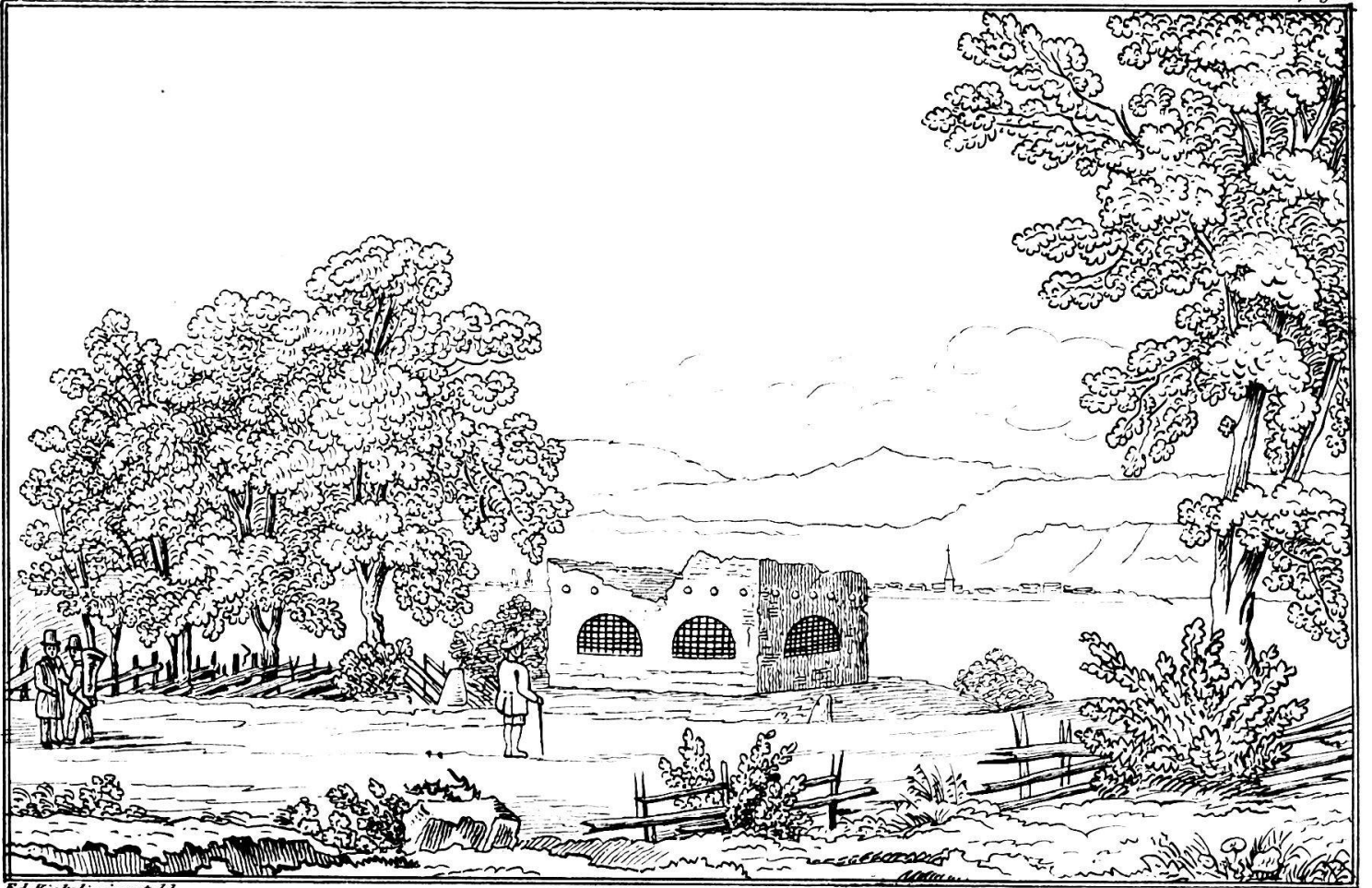
Die Ruine des Beinhauses bei Murten.