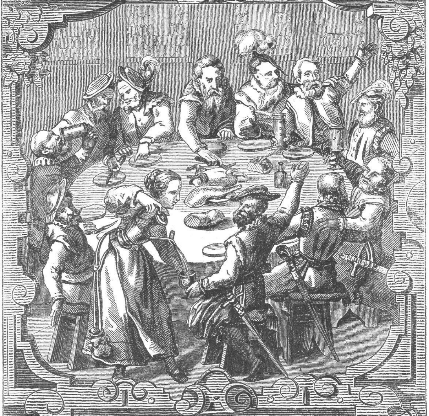
Ein fröhlicher Abendschmaus der Herren Vorgesetzten einer Schrdn. Gesellschaft zu Kaufleuten in Bern 1630. Nach Düng.