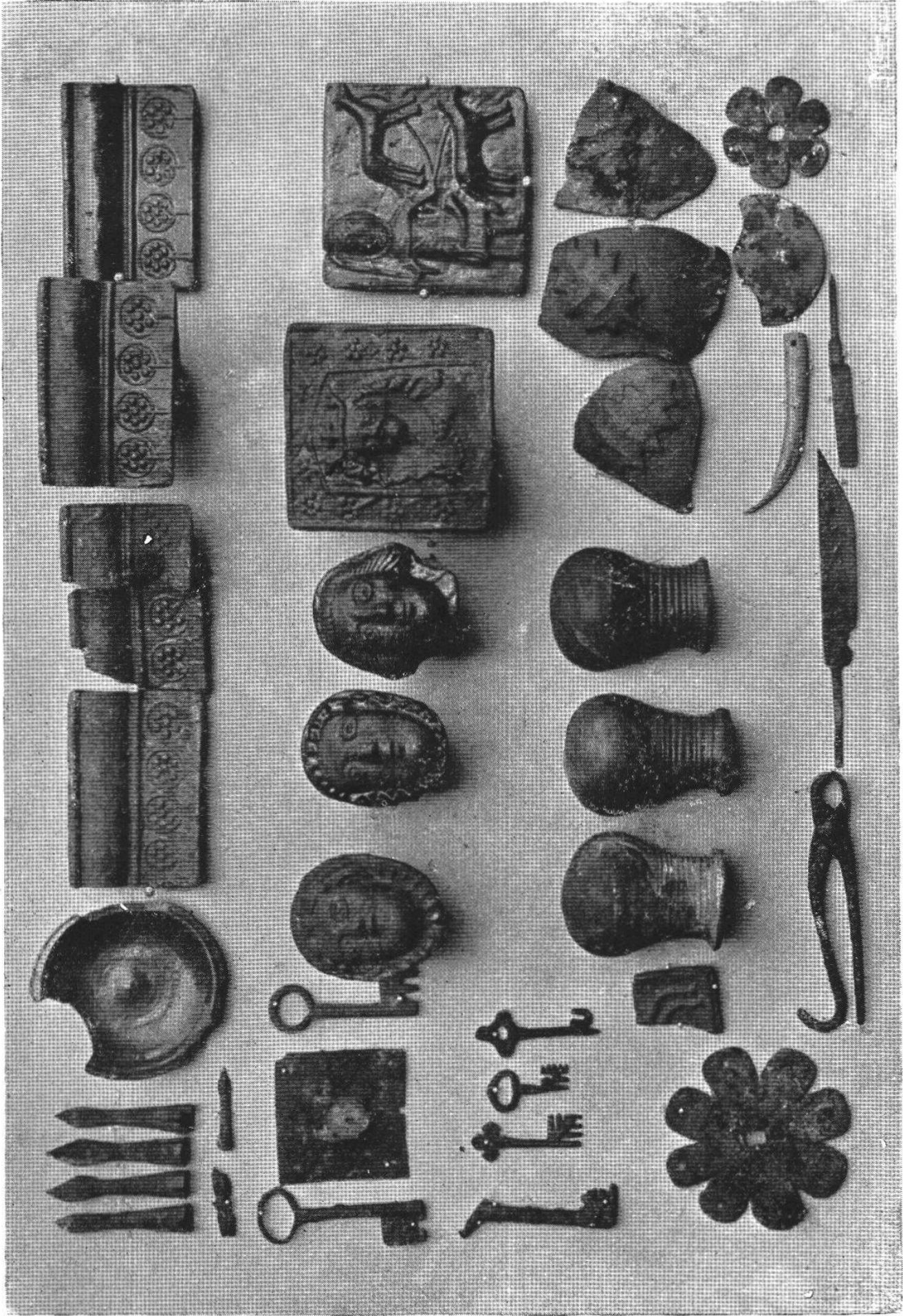
Funde aus der Ruine Rorberg.