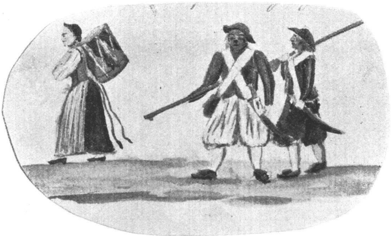
Super aus der Gegend von Murten.

(Landleute von Kerzers, Ferenbalm zc. in braunem Wams und bauschigen, kurzen Kniehosen von ungefärbter Leinwand. Vgl. Schweiz. Idiotikon und das Bild im N. Berner Taschenbuch f. 1911, zu S. 293.)