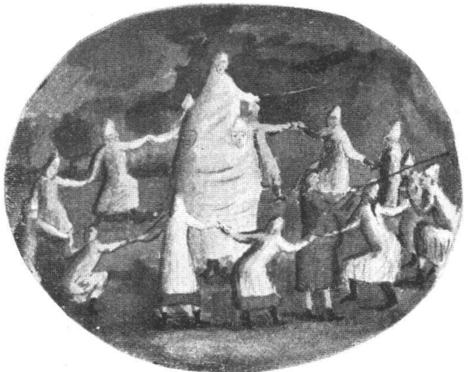
Mummenschanz im Lager (S. 195)