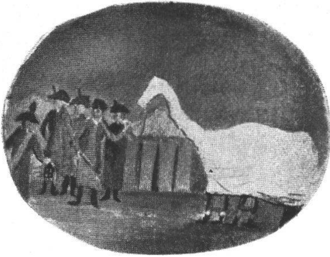
Mummenchanz im Lager (S. 195)