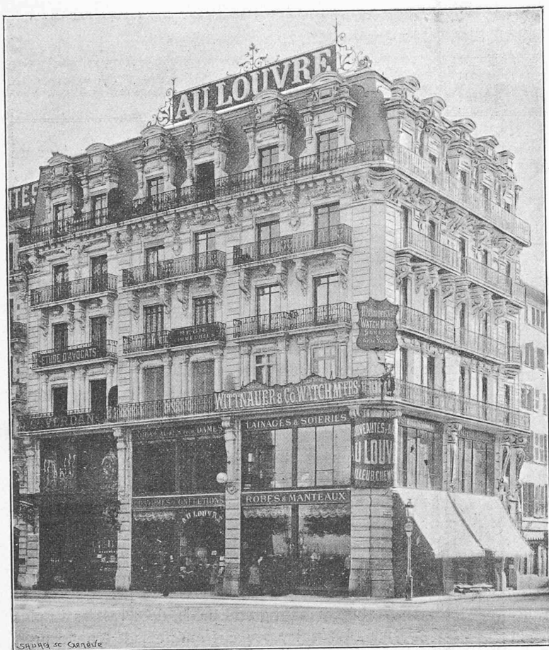
Immeuble construit par M. A. Brémont, architecte.

Situation : 1, Place de la Fusterie. — Destination : Maison de rapport. — Dimensions principales : Face Fusterie, 15 m 65 ; rue du Rhône, 22 m 65. — Observations : Pierre de Saconnière et roche de Divonne. — Tous travaux faits à Genève.