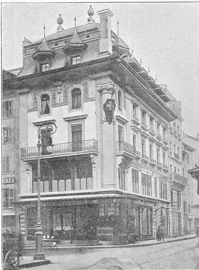
Immeuble construit par MM. Boissonnas et O. Bouvier, architectes.

Situation: Croix-d'Or, 33. — Destination: Commerce et habitation. — Dimensions principales: 20 m × 10 m. — Observations: Roche de Villette « Savonnière », poutres bois sur sommiers fer, tuiles d'Alsace.