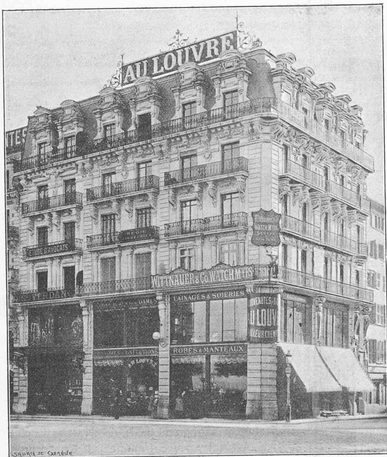
Immeuble construit par M. A. Brémond, architecte.

Situation : 1, Place de la Fusterie. — Destination : Maison de rapport. — Dimensions principales : Face Fusterie, 15 m 65 ; rue du Rhône, 22 m 65. — Observations : Pierre de Saconnière et roche de Divonne. — Tous travaux faits à Genève.