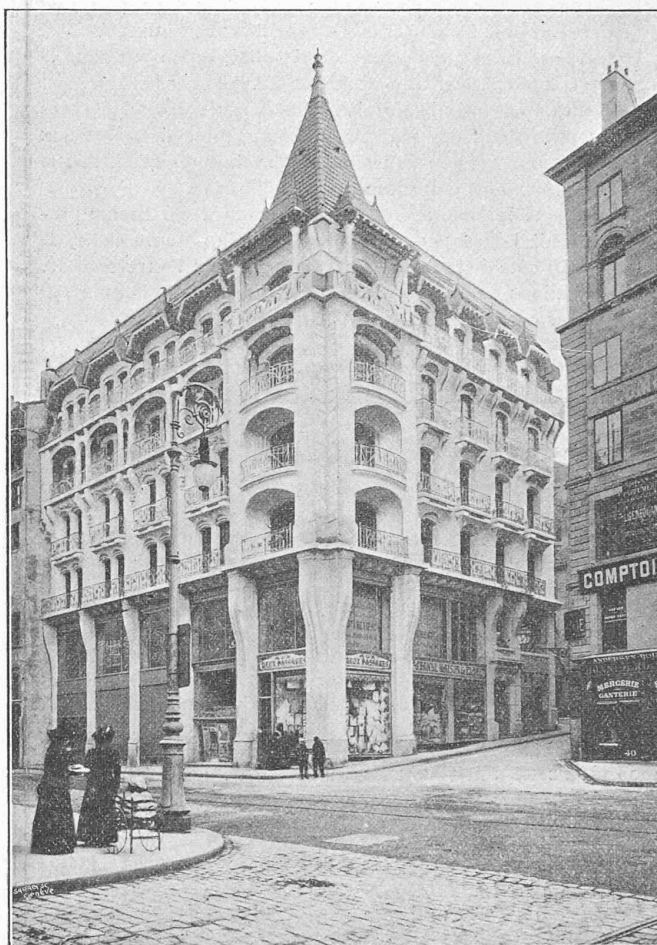
Immeuble construit par M. Eug. Corte, architecte.

Situation: Rue de la Croix d'Or. — Destination: Hôtel de 2° ordre. — Dimensions principales: 23 m 50 façade principale; 18 m 75 façade latérale. — Observations: Roche de Divonne pour paliers. Briques du pays. Pierre des carrières du Midi pour les faces, tuiles émaillées de Bâle. Planchers en bois, rez-de-chaussée et entresol; béton armé en vue de grandes charges.