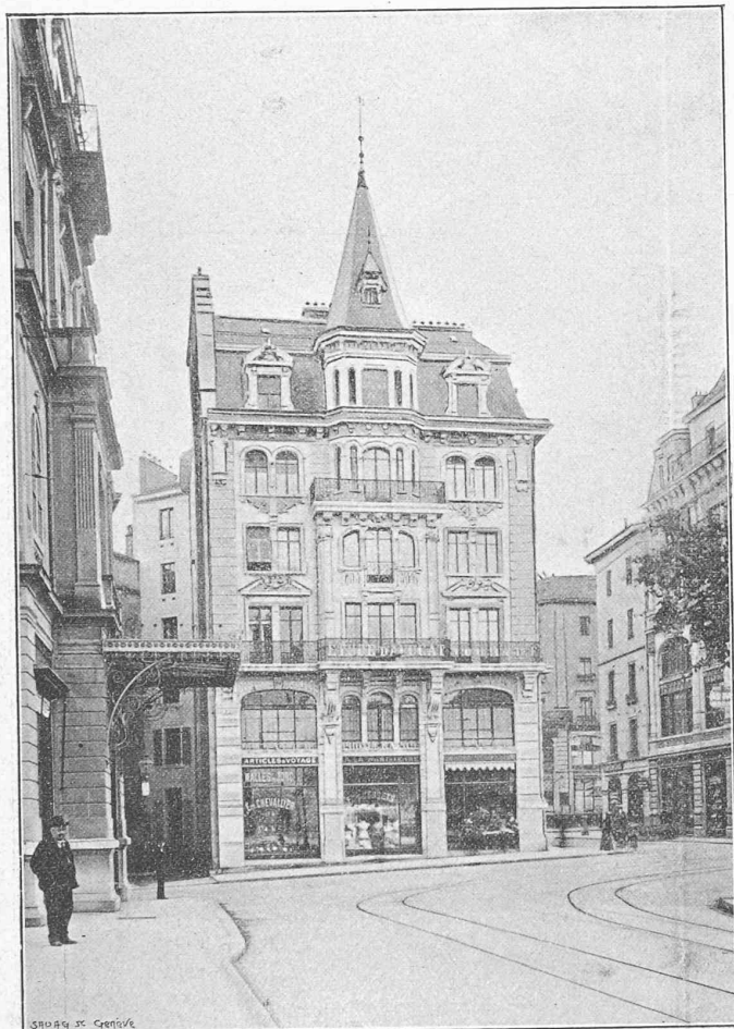
Immeuble construit par M. J.-E. Goss, architecte.

Situation : Place Bel-Air, 4. — Destination : Maison à loyers : Magasins entresol ; bureaux rez-de-chaussée, entresol, 1 er étage ; appartements, 2 e , 3 e et 4 e étages. — Dimensions principales : 13 m × 14 m. — Observations : Facès en roche pour le rez-de-chaussée et entresol ; en Savonnière et Morley pour les étages. Planchers tous en fer. Couverture ardoises et zinc. Eau, gaz, électricité, à tous les étages. Petite surface avec deux façades font ressortir le prix un peu plus élevé que le prix courant.