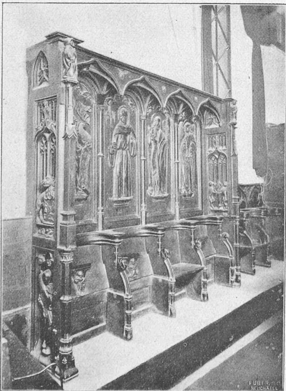
Fig. 10. — Stalles de l'Eglise de St-Gervais avant la restauration.

Dans la seconde moitié du XV me siècle, une grande chapelle se construisit à l'extrados du mur Nord du chœur. Elle est recouverte par quatre voûtes sur croisées d'ogives et fut appelée de St-Protas, du St-Esprit, de la Trinité et des Allemands. Le sol de cette chapelle est au même niveau que celui du chœur. Le pilier à socle octogonal mouluré qui se trouve dans le centre de celle-ci est formé par les nervures des voûtes groupées en faisceaux (fig. 12). D'autres piliers semblables, au nombre de sept, sont engagés dans les angles et dans les murs; un cul-de-lampe sur plan octogonal, mouluré et sculpté, fait saillie sur le pilier séparant les arcades Nord du chœur et reçoit également les retombées des nervures des voûtes; des contreforts à l'extérieur retiennent la