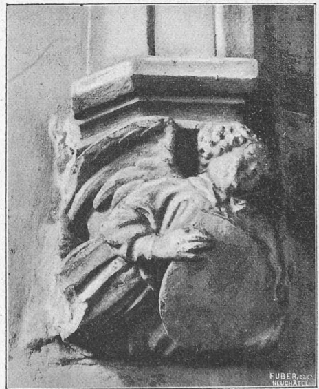
Fig. 6. — Cul-de-lampe (chœur).

voûtes des couloirs de la crypte. La face principale et les contreforts sont en maçonnerie composée de boulets, de briques et d'autres matériaux; ils sont revêtus à l'extérieur en molasse du lac, sauf quelques assises des soubassements qui sont en roche. Les faces latérales de la nef et du chœur, ainsi que la face postérieure, sont appareillées en grosses