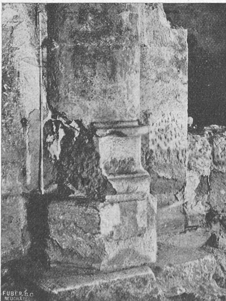
Fig. 4. — Vestiges des bases des grosses colonnes de la nef. (Trouvées sous l'ancienne chaire).

La pierre de taille employée pour la construction des piliers et des nervures des voûtes est la molasse du lac. Les meneaux des fenêtres étaient en grès. Les voûtes sont en tuf, celles des bas-côtés en briques semblables à celles des