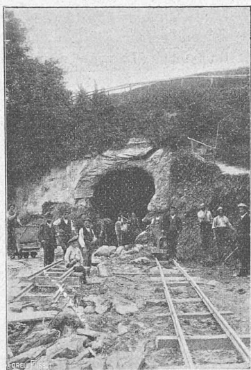
Fig. 12. — Entrée du tunnel du canal d'amenée.

lonnés. Ces tuyaux reposent sur des piliers de béton, placés à 5 m. de distance l'un de l'autre d'axe en axe (fig. 8, 9 et 10).