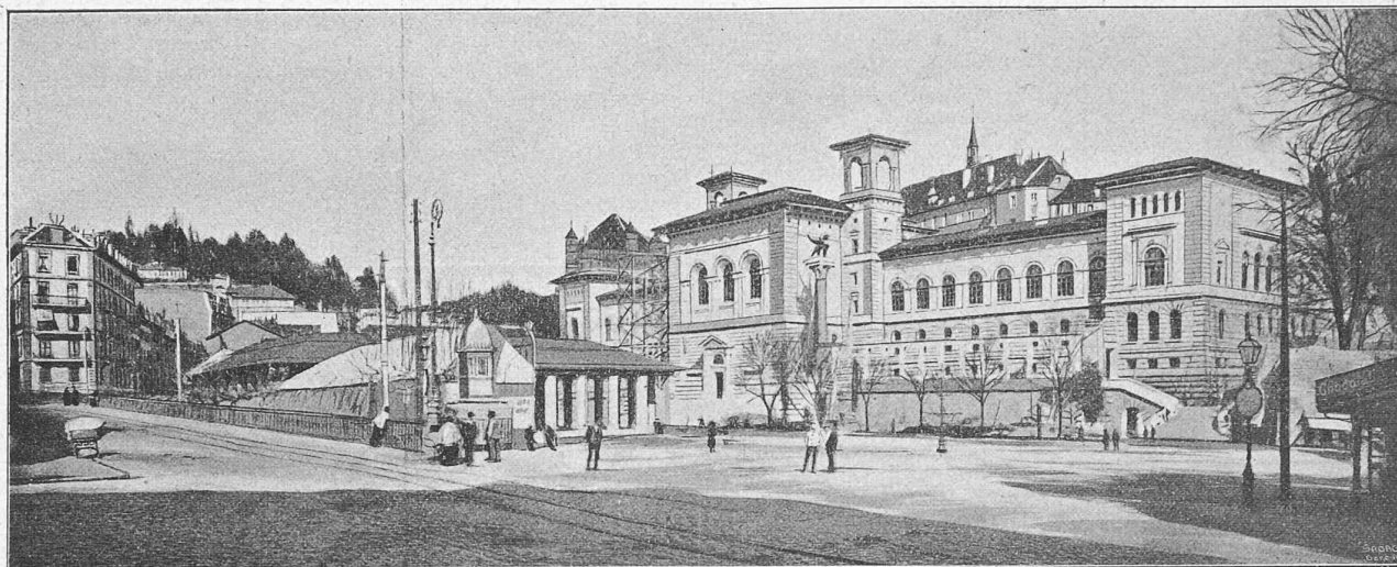
Fig. 1. — Vue générale de la place de la Riponne, à Lausanne, prise depuis l'angle de la rue Haldimand (point O du plan ci-dessous). Au fond, l'emplacement du bâtiment projeté pour la Grande salle. Au premier plan, la « Grenette » (à démolir) ; à droite, le Palais de Rumine (Université).