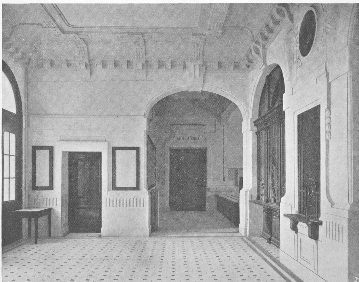
Vue du vestibule.

La nouvelle gare de Renens. — Architectes : MM. Taillens & Dubois, à Lausanne.