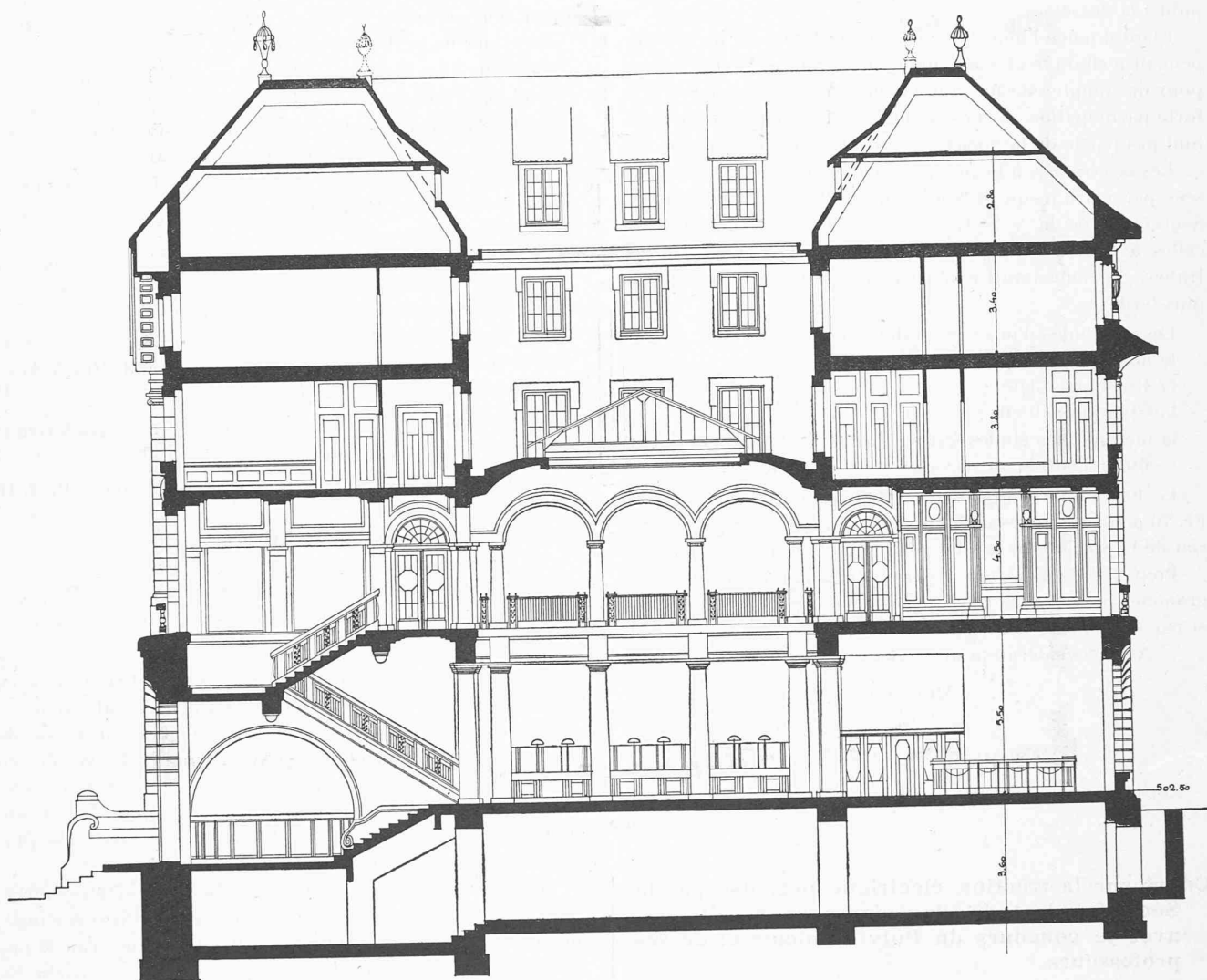
Coupe transversale. — 1 : 200.

le juge à propos, présenter une étude d'adaptation de ces projets à d'autres des emplacements désignés. Cette étude pourra être à l'échelle de 1 : 200.