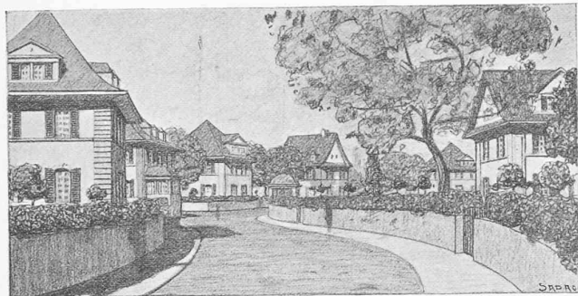
Vue du point D.