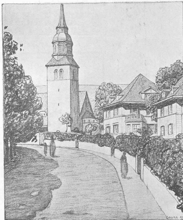
Vue du point E.

L'organisation de conférences, dont nous avons pris l'initiative, a eu un résultat heureux et, comme suite à notre circulaire du 20 septembre 1912, nous vous prions de vouloir