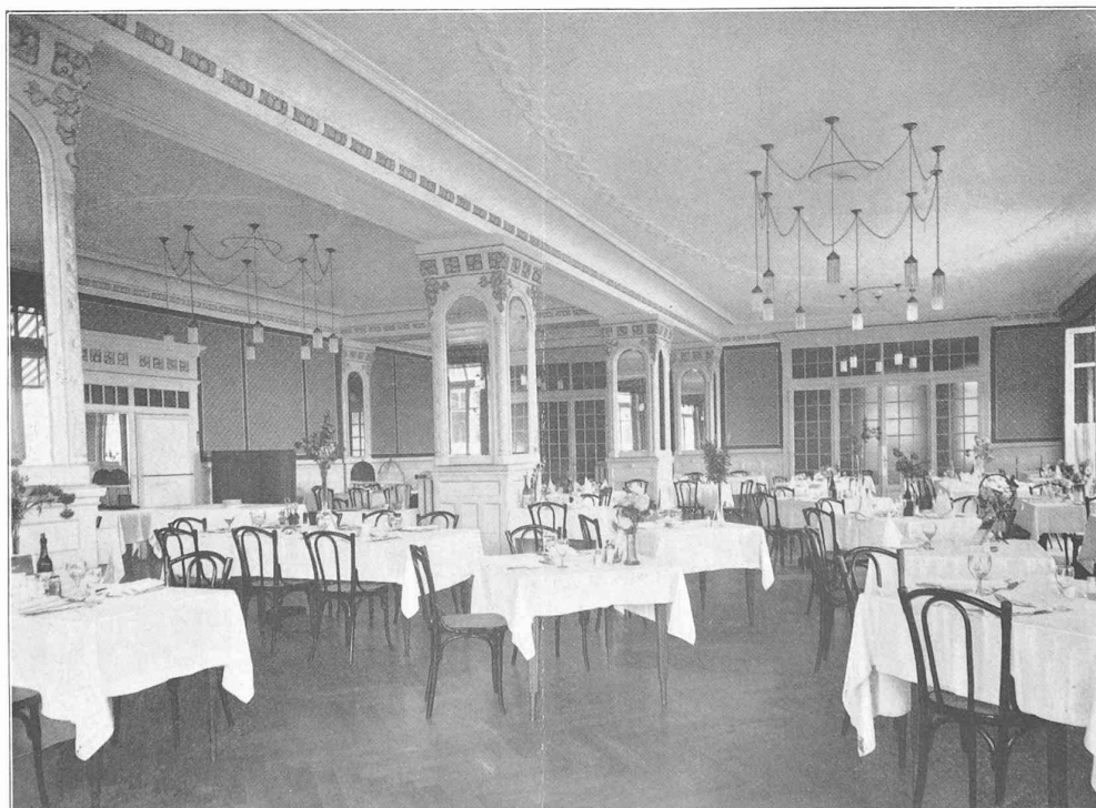
LE GRAND HOTEL DES RASSES

Architectes : MM. Bonjour et van Dorsser, à Lausanne.