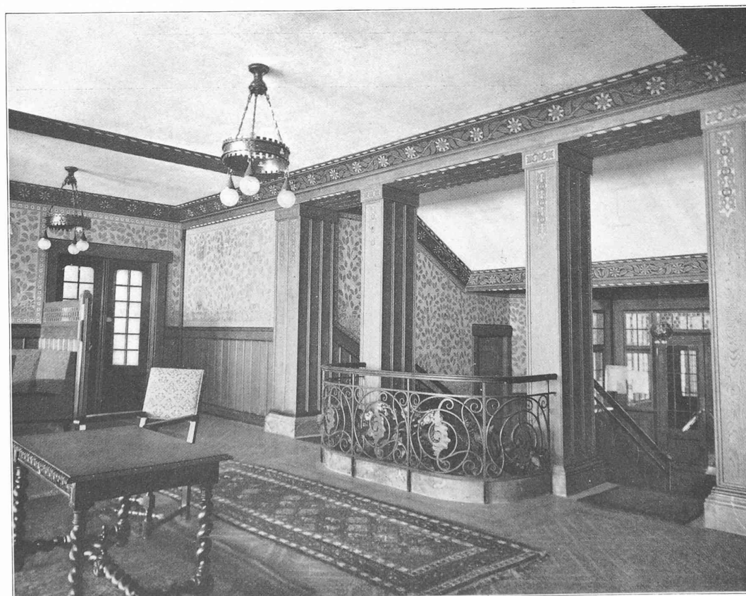
LE GRAND HOTEL DES RASSES

Architectes : MM. Bonjour et van Dorsser, à Lausanne.