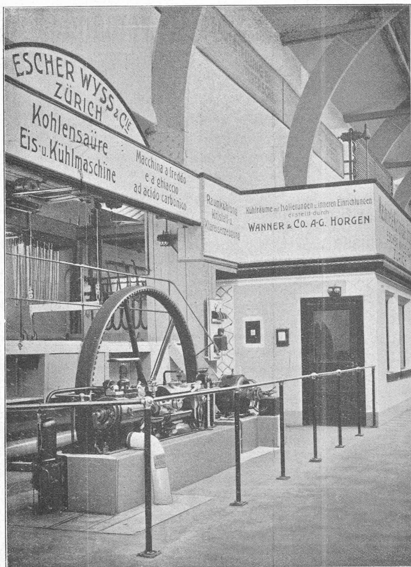
Fig. 27. — Station frigorifique de l'exposition collective des boucheries et charcuteries.

puissance de 70 000 frigories à l'heure, se compose : du compresseur marchant à l'acide carbonique, actionné par un moteur électrique de 28 HP., de divers condenseurs à immersion et du réfrigérant à eau salée. Cette dernière, refroidie constamment par l'évaporation d'acide carbonique, circule dans les faisceaux frigorifiques de trois chambres froides, dont l'une est destinée au vin, une seconde à la bière et une troisième à la viande et aux comestibles.