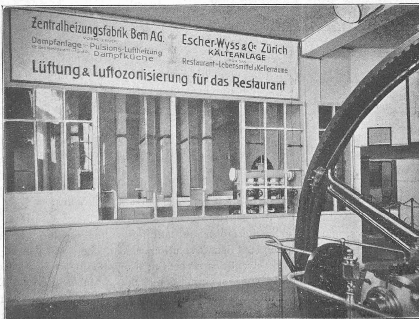
Fig. 26. — Vue du réfrigérant d'air formé par des radiateurs.