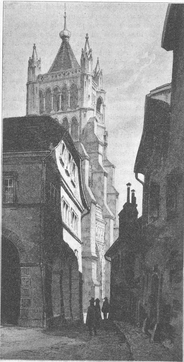
Projet « Maisonneur Abraham de Crousaz » (M. Epitoux). Vue prise du point D.

Sur le Rhône, près de Lyon, l'entrée de la dérivation du canal de Jonage est bien ouverte librement, mais à quelques kilomètres plus en aval on a disposé un barrage de grilles avec vannage, pourvu d'une écluse de protection.