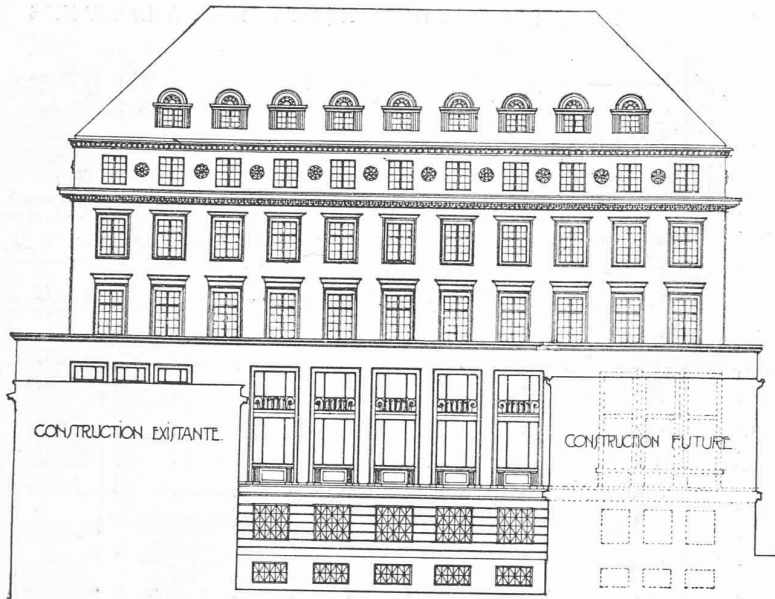
Façade sud. — 1 : 400.