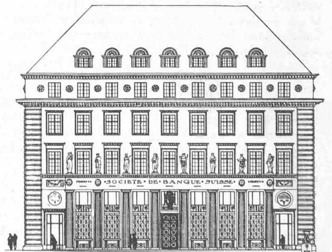
Façade principale. — 1 : 400.