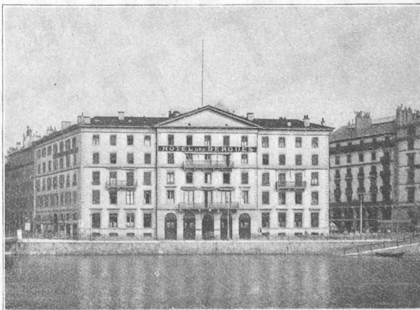
Fig. 2. — Ancienne façade.