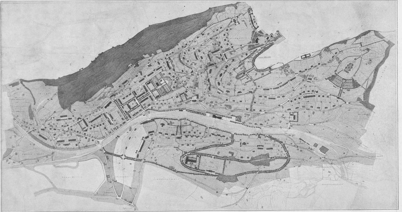
1 er prix projet « Remedur », de MM. W. von Gunten, architecte à Berne et R. Walther, ingénieur à Spiez.

Plan de l'extension de la commune de Spiez — Échelle 1:17500