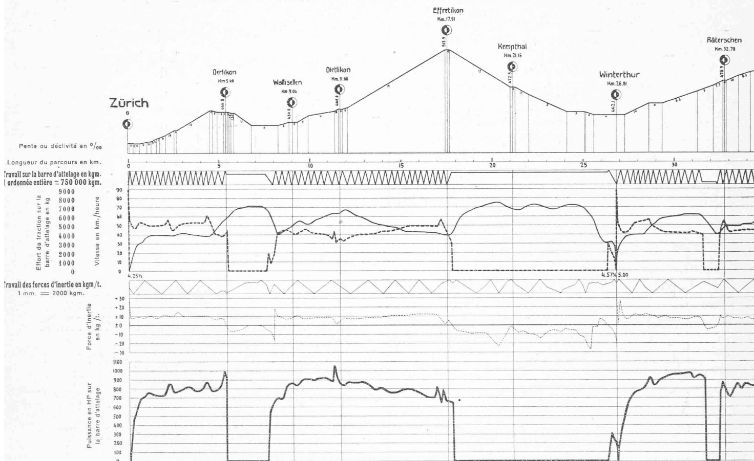
Fig. 43. — Wagon-dynamomètre des Chemins de Fer Fédéraux Suisses. Train 14 (3 mars 1914), locomotive A \frac{3}{5} , N° 608 à vapeur surchauffée, 106 tonnes (avec \frac{2}{3} d'approvisionnements); poids du train 374 tonnes, 45 essieux. Echelles du profil en long : longueurs 1 : 200 000, hauteurs 1 : 4000.

mesure sont des appareils enregistreurs de préférence à inscription par étincelles qui enregistrent la tension, l'intensité du courant et la puissance des moteurs des locomotives. Ordinairement ces appareils sont montés sur un tableau de distribution commun dressé contre la paroi verticale postérieure du compartiment des appareils. Le choix d'appareils enregistreurs à inscription par étincelles perforantes permet d'obtenir des diagrammes en coordonnées exactement rectilignes (et non en arcs de cercle comme dans les appareils ordinaires) sur la bande de papier. Celle-ci se déroule sous l'action, non pas comme c'est ordinairement le cas, d'un mouvement d'horlogerie, mais d'une transmission mécanique de mouvement en relation directe avec le mécanisme d'avancement de la bande de papier sur la table des appareils du dynamomètre; cette disposition permet la comparaison rapide et commode des valeurs correspondantes des deux bandes de diagrammes. Les réducteurs de tension et de courant nécessaire aux appareils enregistreurs se trouvent sur la locomotive.