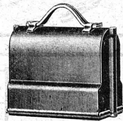
Niveau emballé, 1/6 grandeur naturel