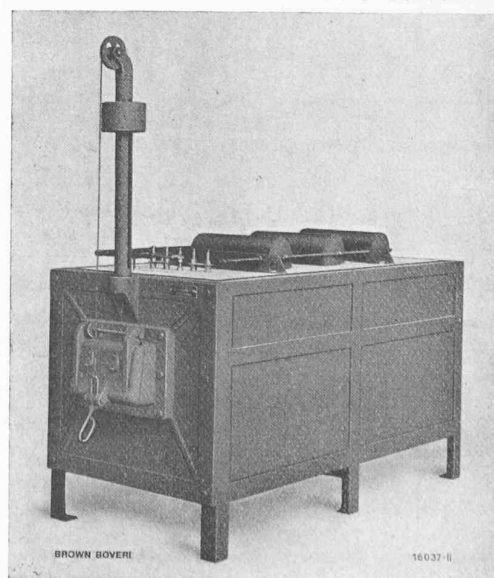
Four électrique à recuire les métaux, système B. B. C.

D'autre part, les entreprises de production et de distribution d'électricité accueilleront très favorablement des usagers de ce genre, car la puissance absorbée est à peu près constante et le four fonctionnant avec \cos \varphi = 1 contribuera donc à améliorer le facteur de puissance des installations existantes.