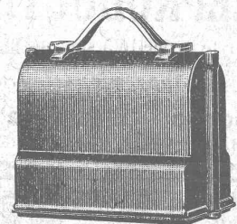
Niveau emballé, 1/3 grandeur naturelle

S. A. de Vente H. Wild - Heerbrugg Téléphone 95 (St-Gall)