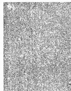
Fig. 2. — Le même acier recuit 5 minutes à 750° C., puis refroidi lentement à l'air.