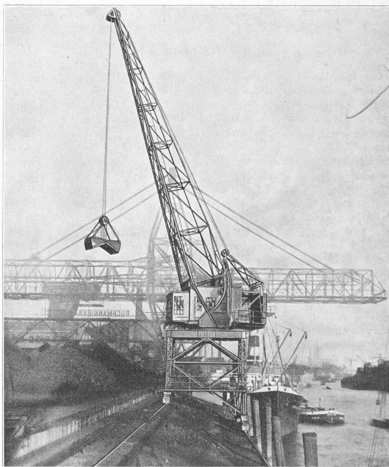
Fig. 3. — Grue de quai, à volée inclinable, dans sa position de portée minimum : 8 m.

Dériaz est aussi connu par de nombreuses constructions industrielles, auxquelles il sut toujours donner un caractère d'unité architecturale, tout en tenant compte avec habileté des nécessités d'exploitation. Citons, entre autres bâtiments à Genève, la Fabrique de remontoirs