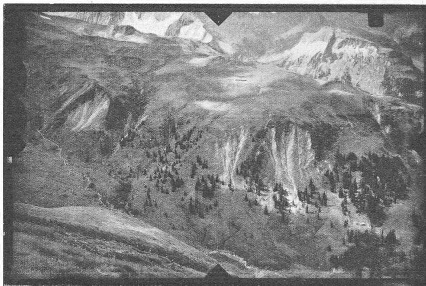
Fig. 5 et 6. — Mensuration cadastrale de Mels par stéréophotogrammétrie terrestre. Altitude : 2079,30 m. — Longueur de la base : 187,70 m.

2 o mensuration : 5 à 10 fr., en moyenne 8 fr. par hectare, ou 0,7 % de la valeur du terrain.