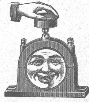
Palier refroidi pendant la marche au moyen de graisse ou de l'huile réfrigérante Brun.