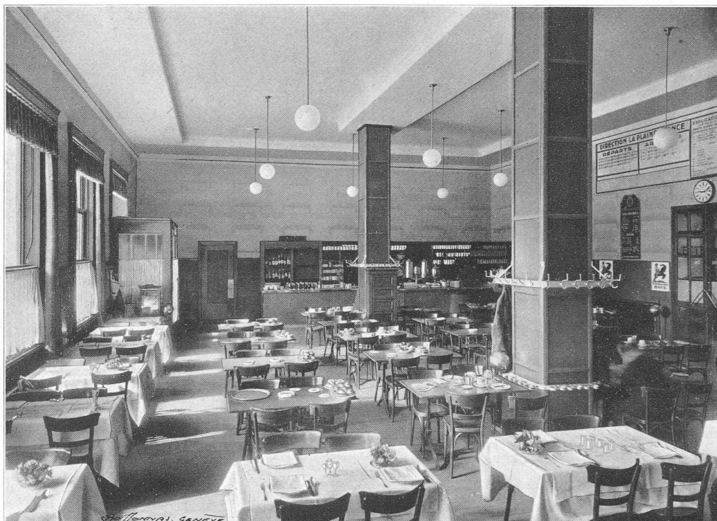
Buffet de III m e classe.