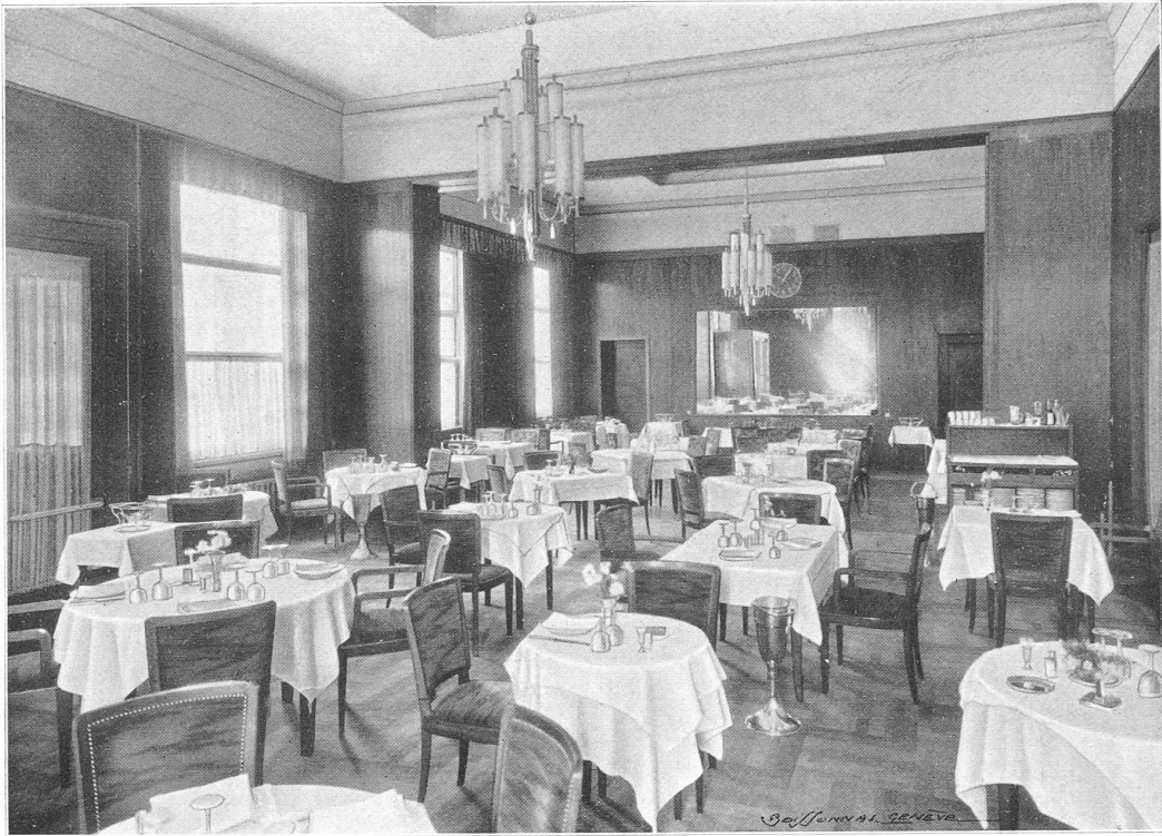
Buffet de 1 re classe.