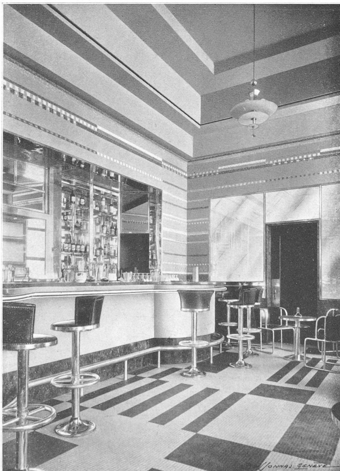
En haut : Buffet de II me classe.