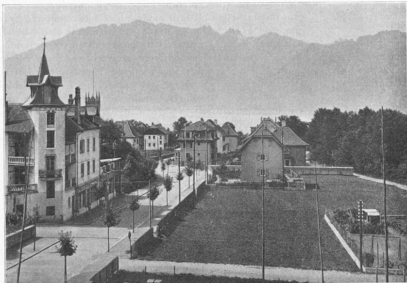
Fig. 3. — Vue prise du bâtiment sud. Au fond, les montagnes de Savoie.

la rue réclame de la Commune, de l'Etat ou de la Confédération ce qu'il n'oserait jamais demander à un particulier ; et, le pire, c'est que les dirigeants de ces collectivités accordent souvent, pour des raisons que nous voudrions ici ignorer, ce qu'un propriétaire privé refuserait sans hésiter. D'où, source de dépenses multiples, diminution de la rentabilité, allant quelquefois jusqu'à la suppression de celle-ci.