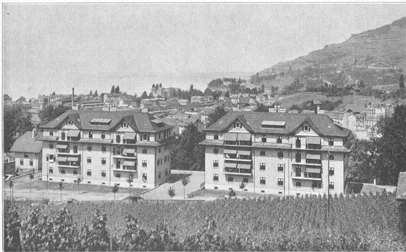
Fig. 1. — Vue générale des deux immeubles.