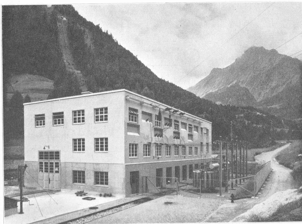
Fig. 39. — Disposition des transformateurs.