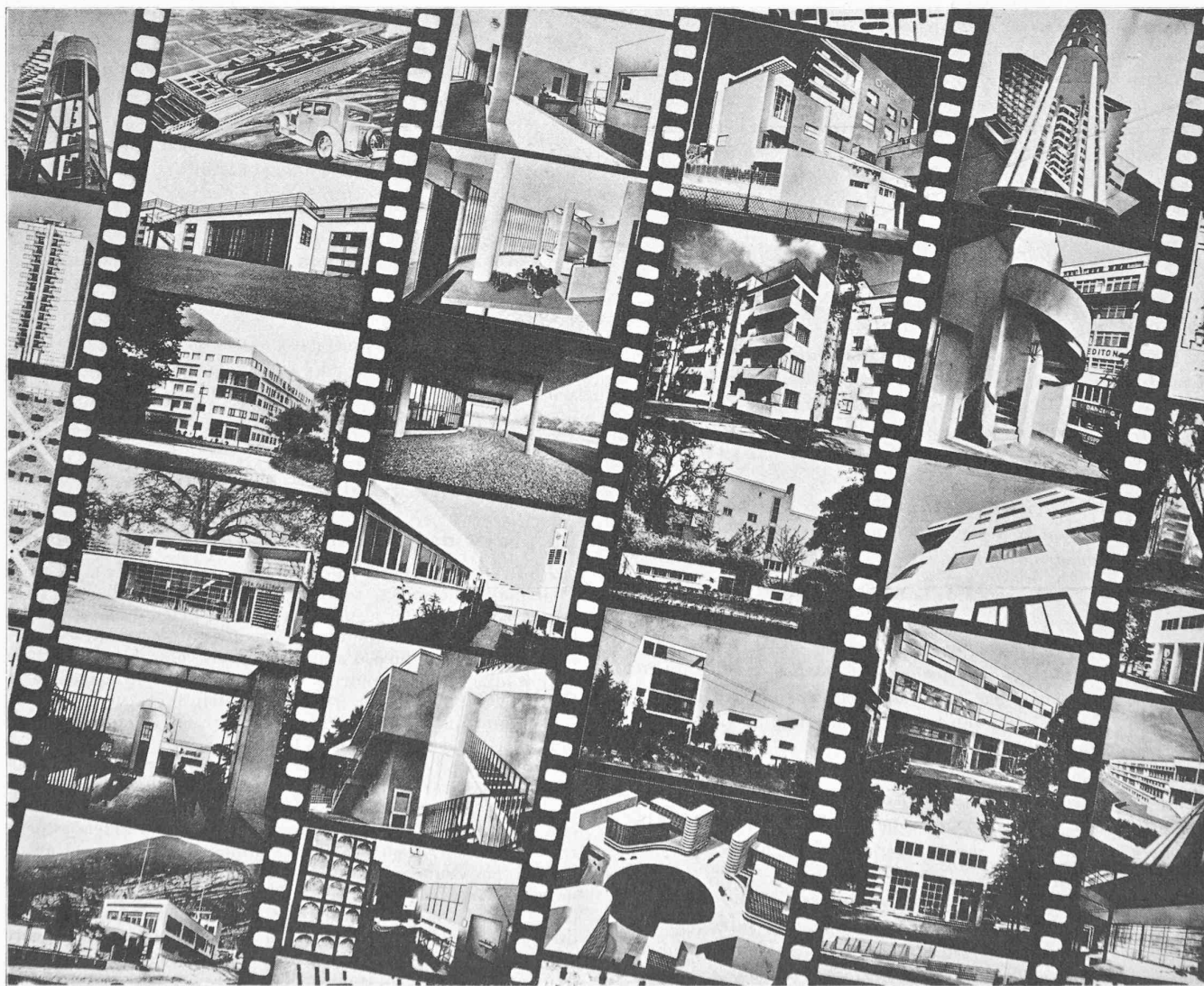
Fig. 2. — Photomontage extrait de l'ouvrage «Les éléments de l'architecture fonctionnelle», par Alb. Sartoris.