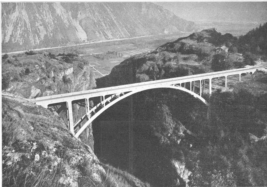
Fig. 1. Le pont de Gueuroz, sur le Trient.

Vue prise vers l'aval. A droite, on aperçoit le plateau de Gueuroz, sur lequel débouche la nouvelle route venant de Martigny.