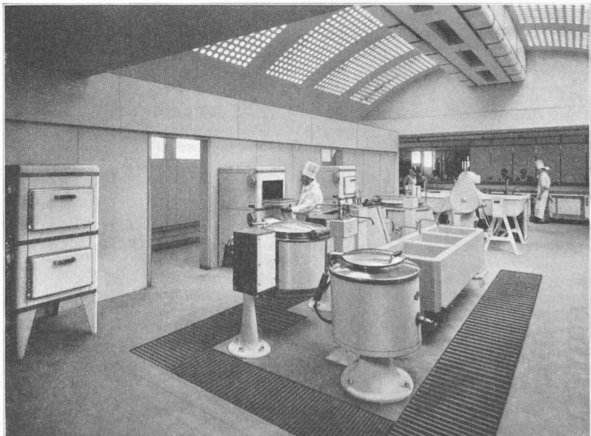
Fig. 3. — Cuisine de l'immeuble Vienne-Rocher.