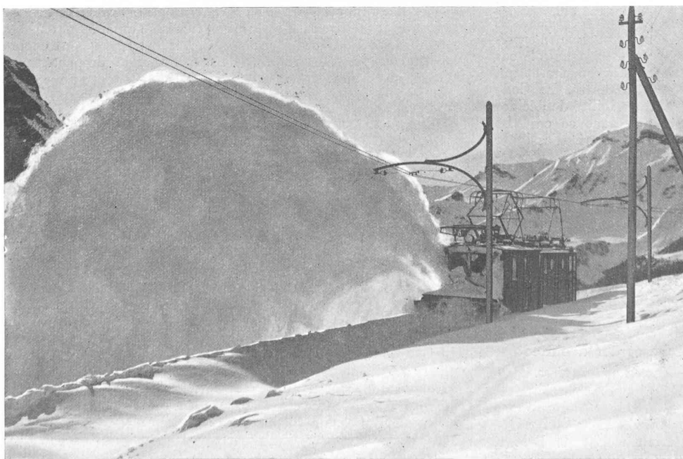
Chasse-neige électrique du chemin de fer de Wengernalp, se dirigeant vers la Petite Scheidegg.

Aux essais et durant le service très dur qu'ils ont ensuite assuré, la locomotive et le chasse-neige se sont très bien comportés. Il a été franchi des masses de neige de près de 2 m de haut, en chassant environ 150 m 3 à la minute.