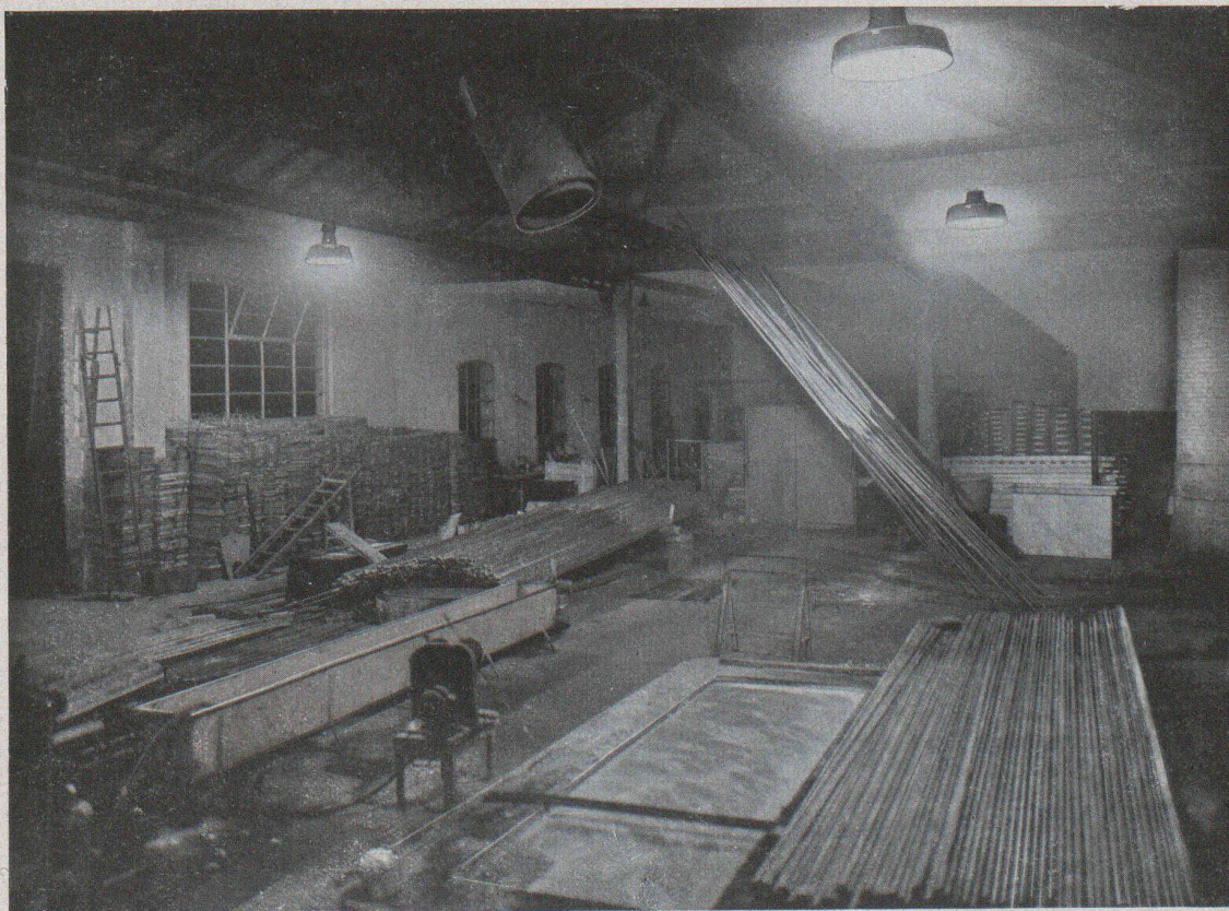
Zingage à la lumière de lampes Osram à vapeur de mercure (lumière bleu-verdâtre).

Ces deux vues extraites d'une élégante brochure, « Les lampes Osram à vapeur métallique pour le travail, la publicité et le trafic » mise à la disposition du public par Osram S. A. , à Zurich, (Limmatquai, 3) donnent une idée du parti avantageux que l'industrie peut tirer de ces lampes, dotées, outre la tonalité si caractéristique et précieuse de leur lumière, d'un rendement lumineux qui en fait les sources lumineuses les plus économiques d'aujourd'hui.