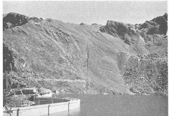
Fig. 5. — L'Illsee.