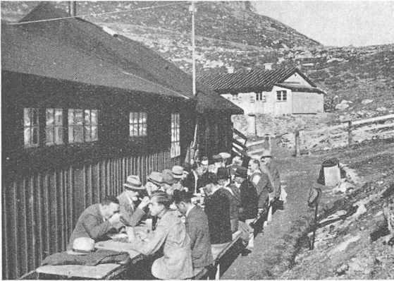
Fig. 4. — Déjeuner à Meretschi.

A certaines époques de l'année, à certains jours de la semaine, à certaines heures de la journée, la pompe est mise en marche. La station génératrice d'Oberems, utilisant en temps normal le premier palier de la chute de l'Illsee, est alors nécessairement hors service, puisque la conduite forcée dont elle dépend se trouve employée en sens inverse, comme conduite de refoulement de la pompe. Grâce à cet artifice de pompage, les possibilités d'accumulation relativement restreintes du bassin versant de l'Illsee vont se trouver augmentées d'une partie des capacités du bassin de la Tourtemagne.