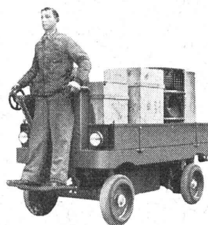
Chariot de 1,5-2 tonnes à pont fixe